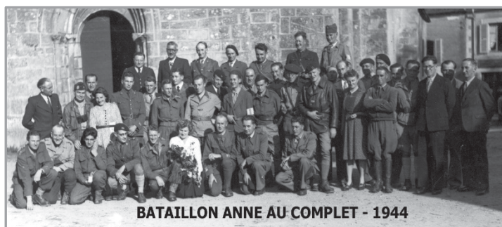
BATAILLON ANNE AU COMPLET - 1944

Depuis quelques semaines la communauté de communes du pays Dunois a commencé une « Collecte mémorielle ».