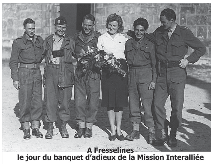
A Fresselines le jour du banquet d'adieux de la Mission Interalliée

Les documents remis en main propre seront scannés puis vous seront restitués.